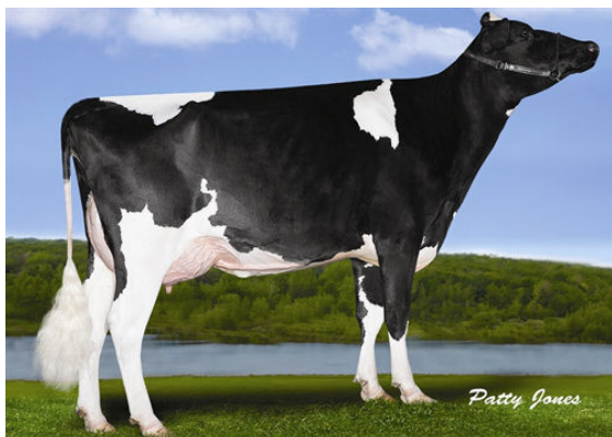
CLEROLI MP WINDBROOK BLUFFY